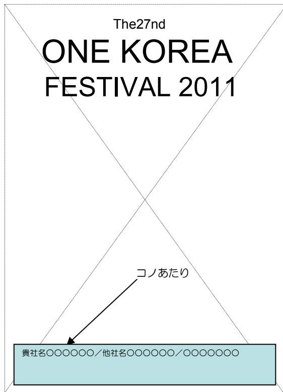
広告掲載イメージ